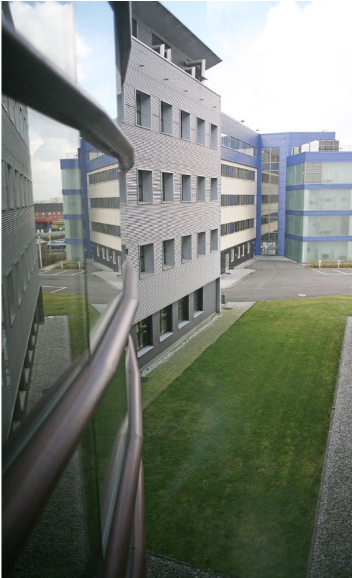
L'IBMM, sur le site de Gosselies...

La Belgique est aussi connue pour la qualité de ses chocolats et de ses pralines, le doré et le croquant de ses frites servies avec les moules, ses bières de terroir... Au-delà de ces quelques clichés, vous aurez l'occasion de découvrir, durant votre séjour, une « autre Belgique », plus complexe, intéressante et riche. De nombreux guides papier ou en ligne sur le pays et sa capitale vous permettront de goûter à toutes les subtilités offertes à votre curiosité. C'est ce que nous vous souhaitons !