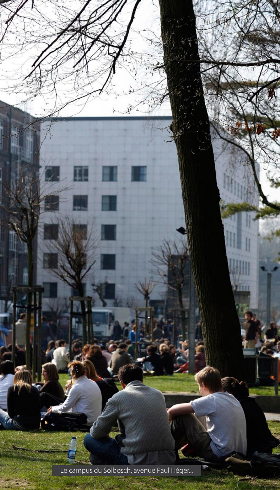
Le campus du Solbosch, avenue Paul Héger...