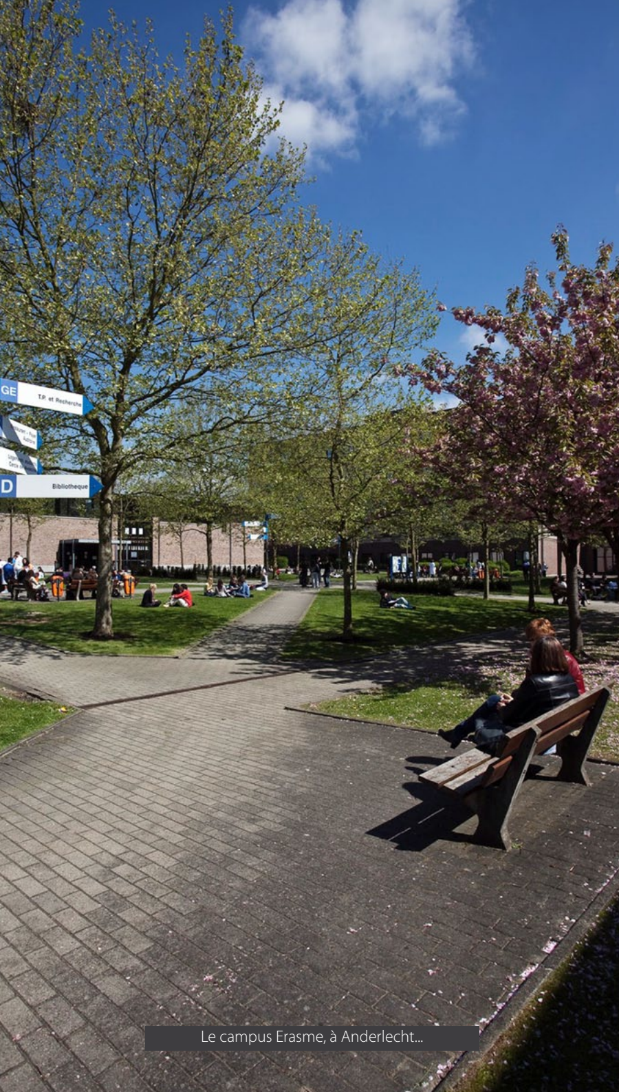
Le campus Erasme, à Anderlecht...