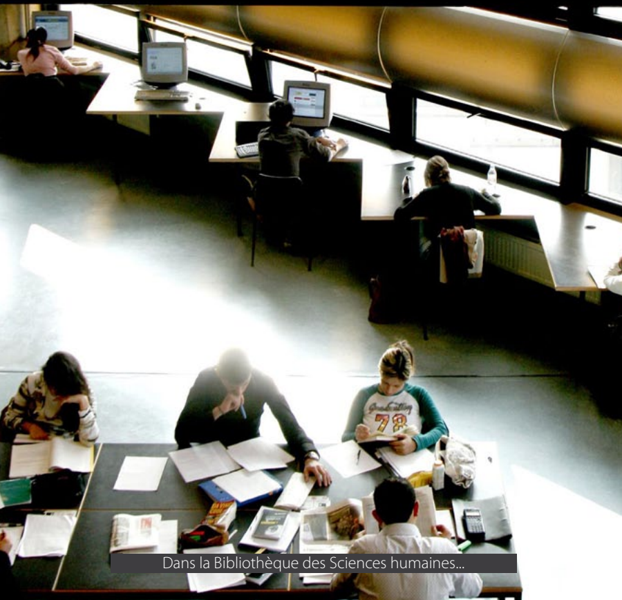
Dans la Bibliothèque des Sciences humaines...

mique ; de huit membres étudiants à raison d'un par Faculté ; d'un membre étudiant représentant les Écoles et Instituts d'enseignement et de recherche indépendants des Facultés ; de cinq membres élus en son sein, par le personnel administratif, technique, de gestion et spécialisé (PATGS); de quatre membres élus parmi les personnes représentatives de la vie sociale, politique et économique du pays, ayant témoigné de leur attachement à l'Université.