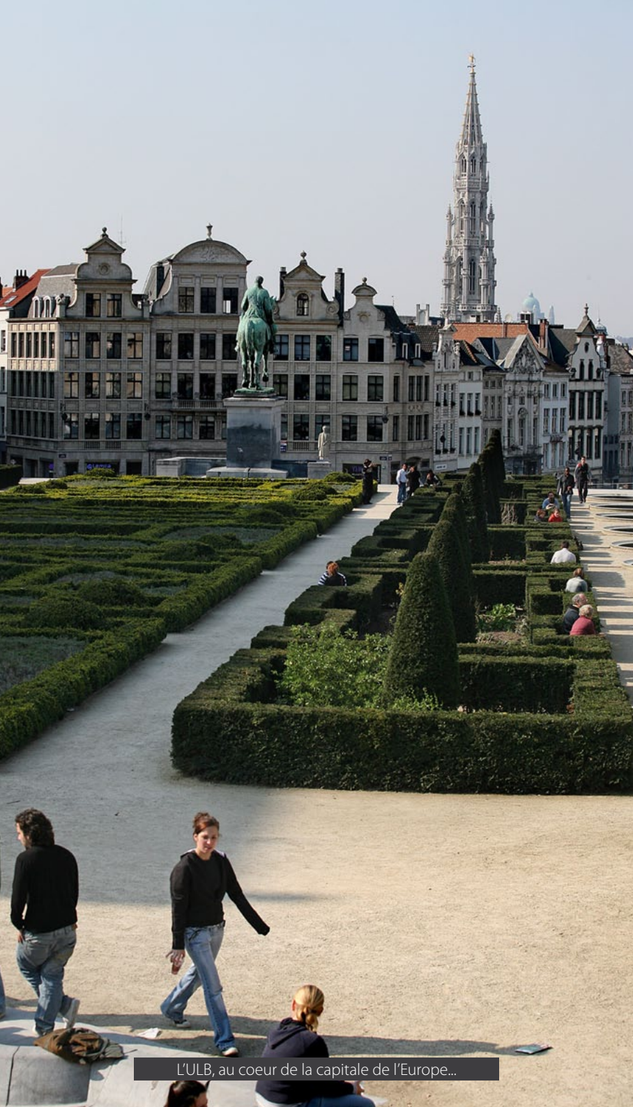
L'ULB, au coeur de la capitale de l'Europe...